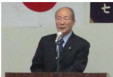
あいさつをする会長

令和5年5月26日午後6時より令和5年度通常総代会を開催しました。①令和4年度事業報告ならびに収支決算(付特別会計収支報告)②令和5年度事業計画ならびに収支予算③定款変更④運営規約変更⑤運営資金借入限度額ならびに取引金融機関⑥役員補充選任の6つの議案が審議され承認・決定されました。